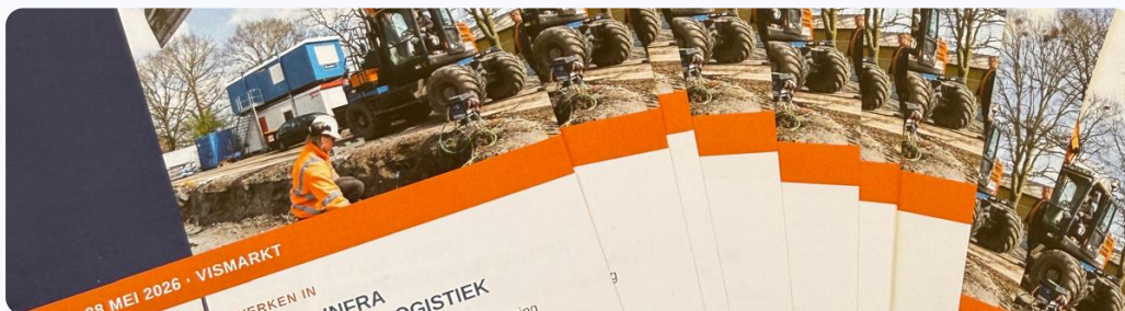
Onze stand met folders, flessen en sleutelhangers

Bedankt aan iedereen die langskwam. Tot de volgende keer!