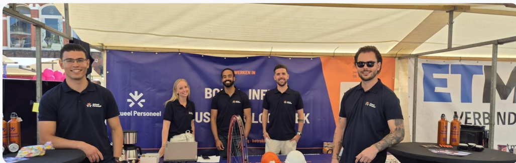
Met het team op de Vismarkt in Groningen

Op 28 mei stonden we met het team op de Vismarkt in Groningen. Een drukke en energieke dag met veel goede gesprekken en enthousiaste kandidaten. Fijn om te zien dat zoveel mensen de weg naar ons wisten te vinden.